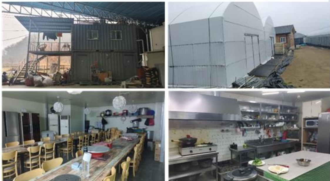
그림 2 상주 딸기 농장 두 곳의 이주 노동자 주거지와 식당